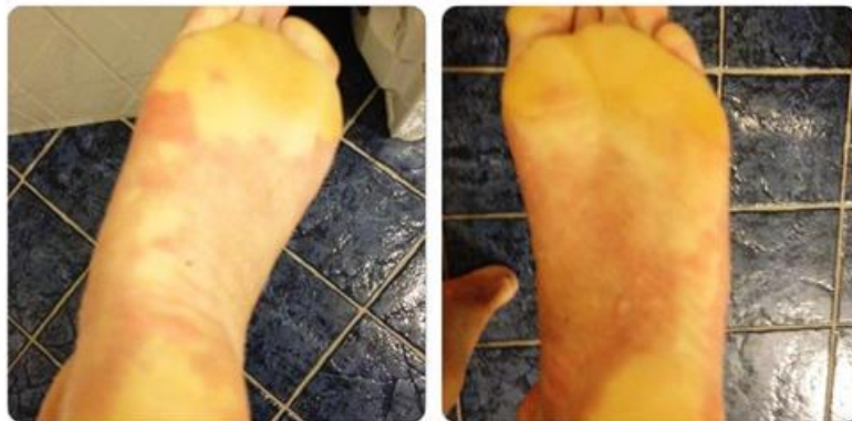
Fremprovosert med neurofeedback hos fysioterapeuten november 2014

Jeg stod i mer destruktive nære relasjoner enn konstruktive