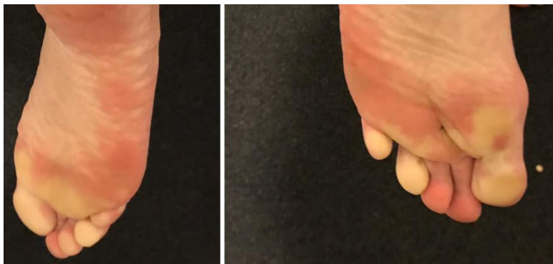
Fremprovosert desember 2018 med intensjonen; Jeg vil føle 13år